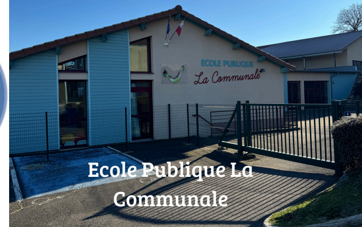
Ecole Publique La Communale