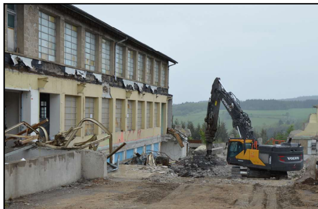
Travaux de démolition et de terrassement

La maîtrise d'oeuvre a été confiée au bureau d'études B Ingénierie de Firminy. La société Malia TP de Saint Didier en Velay a été retenue, pour un montant global de travaux de 218 000 € HT, largement subventionné par un financement du "fonds friche" de 190 000 € de l'Etat dans le cadre du Plan de Relance.