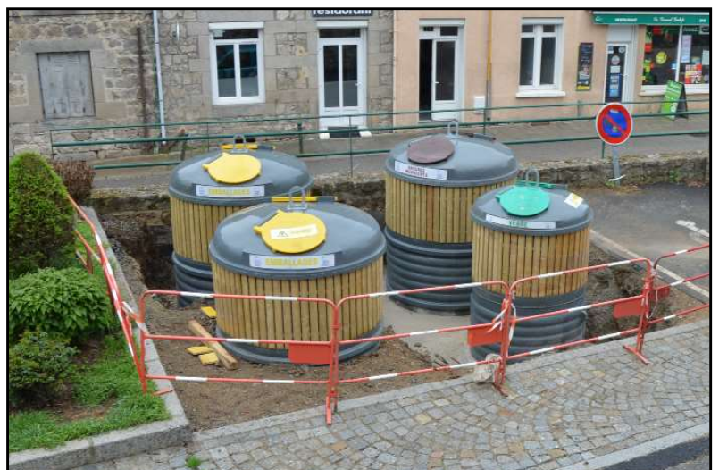
Containers en cours d'installation rue de l'église

L'ensemble de la commune devrait être équipé progressivement au cours des prochaines années, comme toutes les autres communes du syndicat.