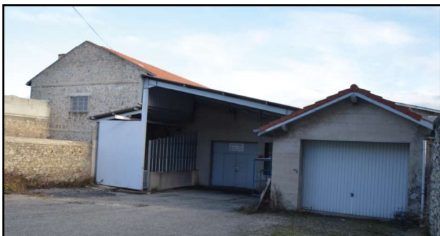
Tènement ex-usine Cheynet avant travaux

Cette entreprise a procédé au désamiantage de la toiture du tènement de l'ex-usine Cheynet, rue du Centre et à la démolition de cette partie de l'ancienne usine.