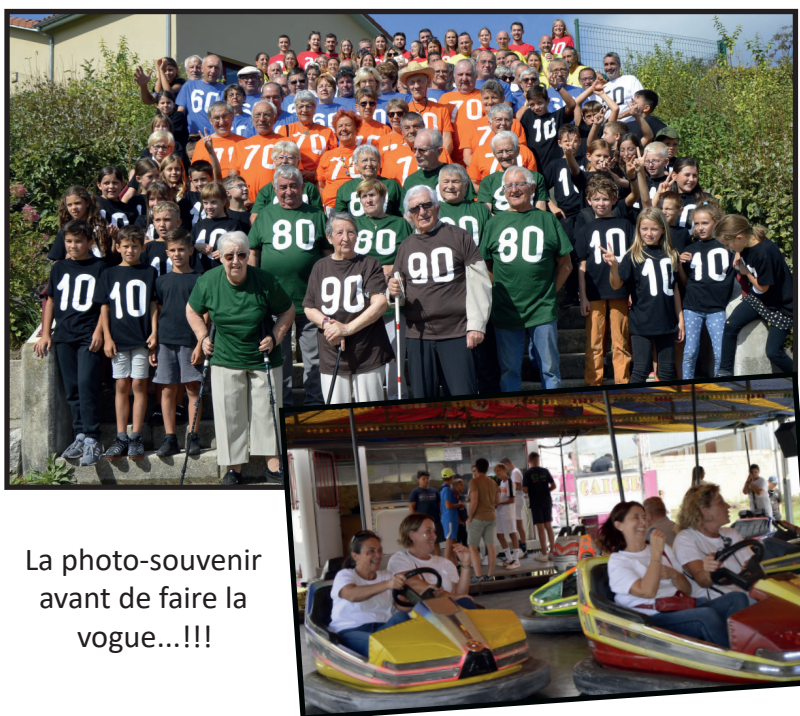
La photo-souvenir avant de faire la vogue...!!!