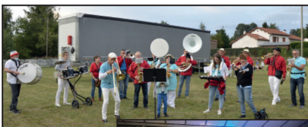
Animation musicale avec la Band'à Banda et le groupe Tribute