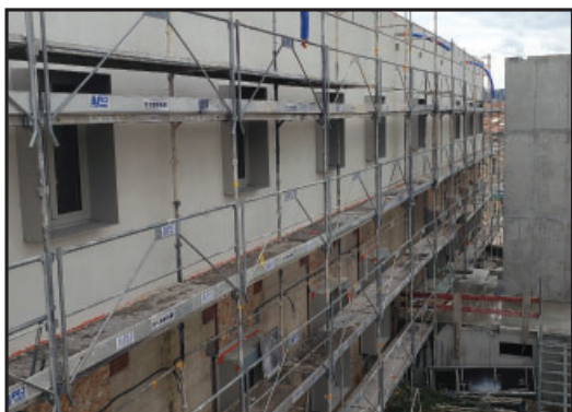
Isolation et enduit sur partie haute des murs extérieurs

Maison de Santé : ouverture en janvier 2022