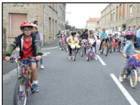
23 vélos fleuris

Société de Chasse, Comité des Fêtes, Amicale des Sapeurs-Pompiers, Club de Basket, Band'à Banda et Commune : une équipe unie et efficace au service d'une belle Fête Patronale .