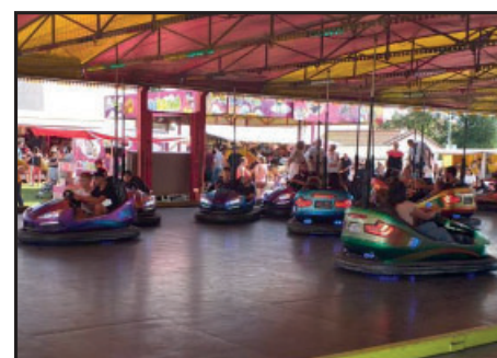
Manèges et attractions