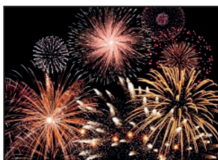
Des feux d'artifices plein les yeux