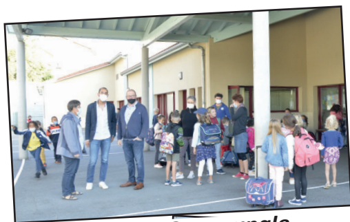
Ecole La Communale

budget annuel pour l'ensemble des écoles