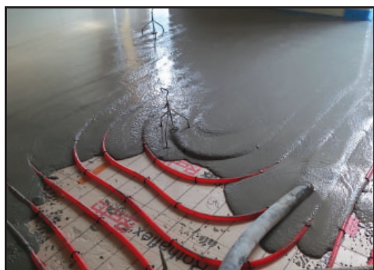
Installation réseaux de chauffage et climatisation, et application chappe liquide