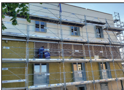
Isolation et pose de parements brique sur partie basse des murs extérieurs