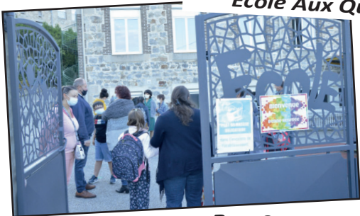
Ecole Don Bosco