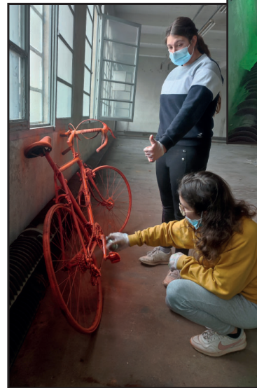
Peinture de vélos décoratifs dans le cadre des chantiers jeunes