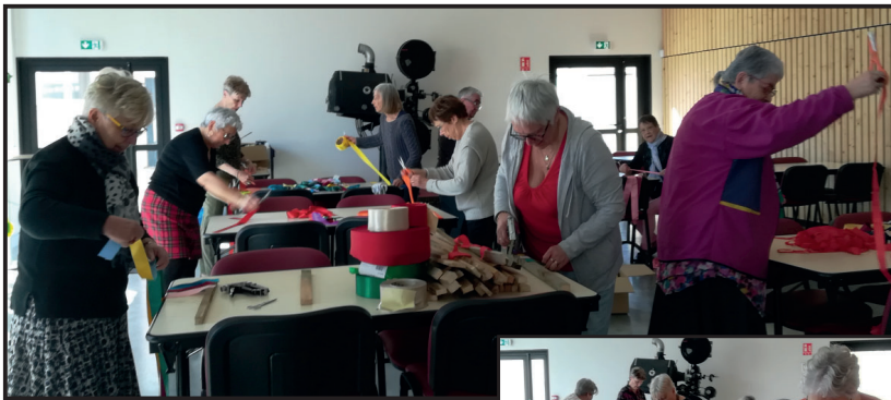
Confection de guirlandes de rubans et cocardes tricolores par les bénévoles des associations

Pour parer notre commune sur le parcours du Tour de France, une équipe de bénévoles issus de diverses associations et les ados des chantiers jeunes de Loire-Semène travaillent depuis plusieurs semaines à la préparation des décorations.